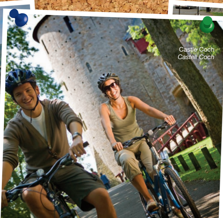
Castle Coch Castell Coch