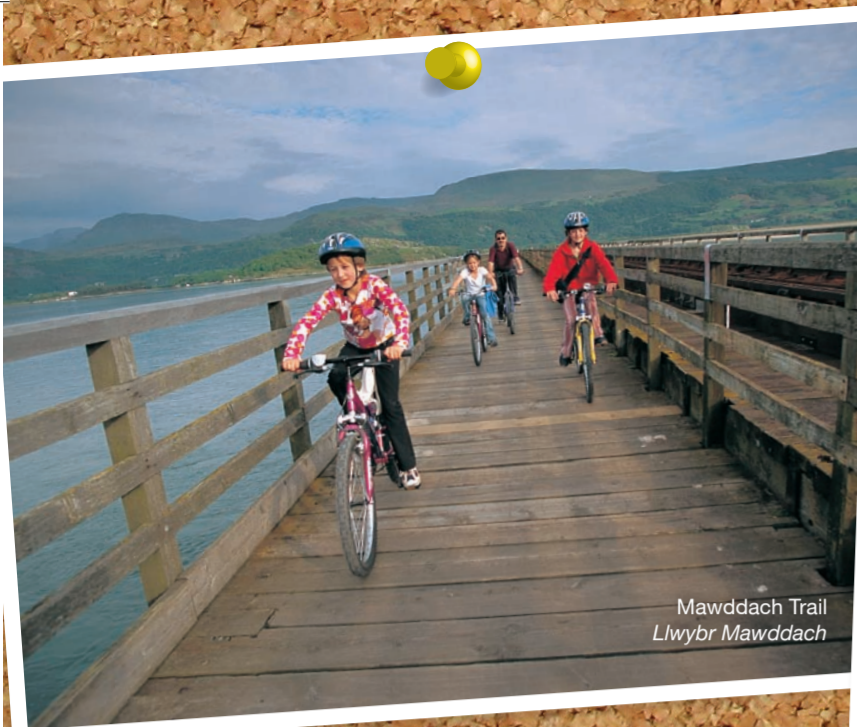
Mawddach Trail Llwybr Mawddach