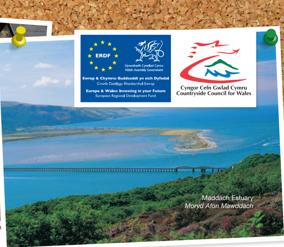
Maddach Estuary Moryd Afon Mawddach