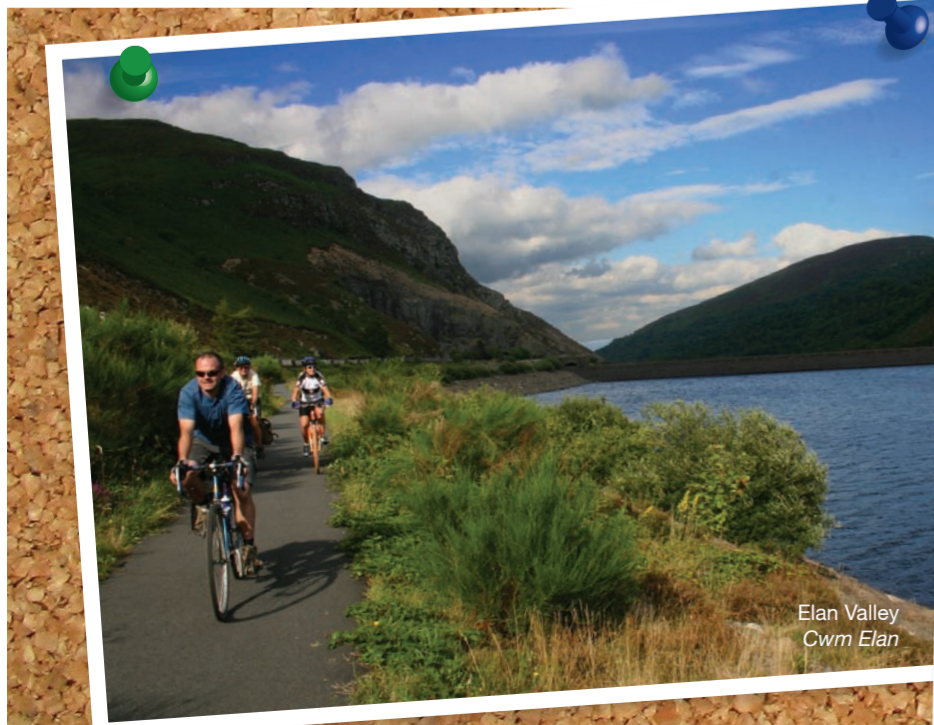
Elan Valley Cwm Elan

Mae Sustrans yn Elusen Gofrestredig Rhif 326550 (Cymru a Lloegr) SCO39263 (Yr Alban).