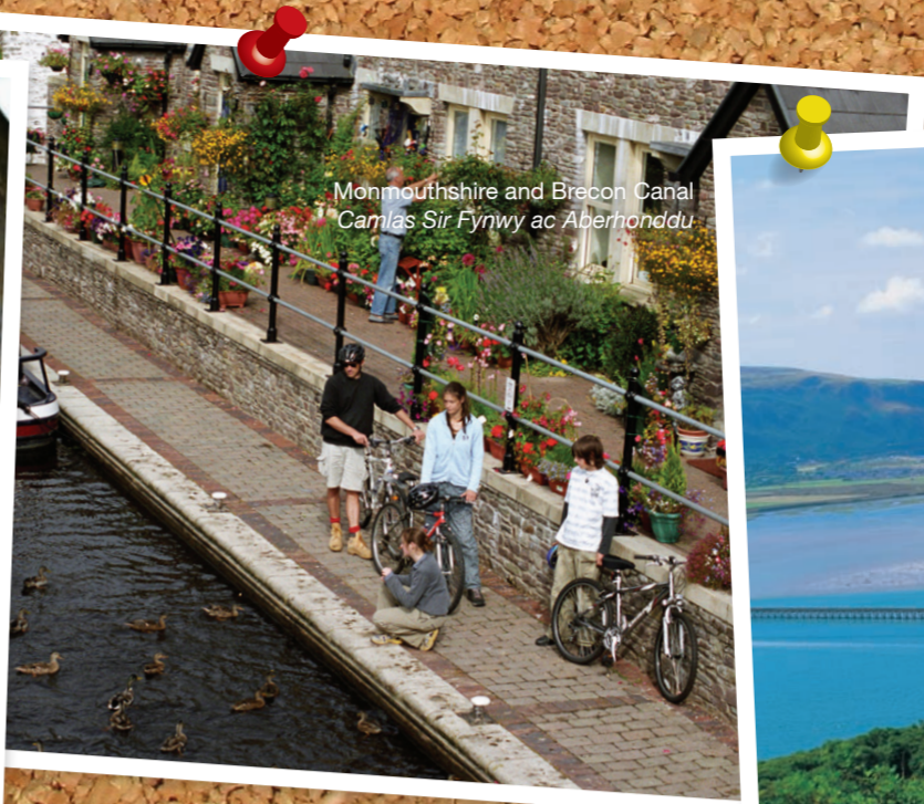
Monmouthshire and Brecon Canal Canlas Sir Fynwy ac Aberhonddu