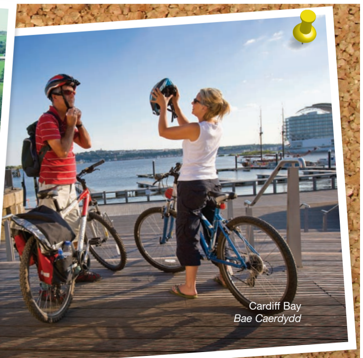
Cardiff Bay Bae Caerdydd