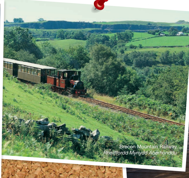
Brecon Mountain Railway Rheilffordd Mynydd Aberhonddu